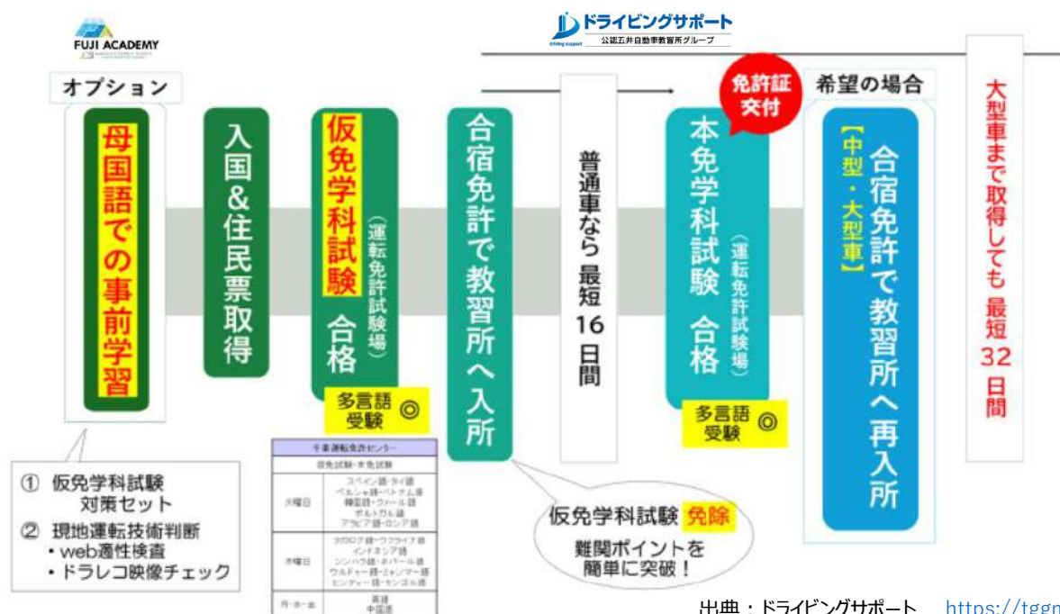
図2：「合宿免許安心パッケージ」概要